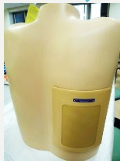
胸腔・心嚢穿刺 胸腔ドレナージ