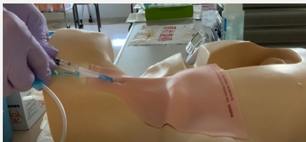
中心静脈カテーテル挿入