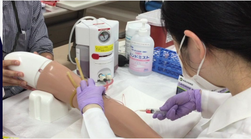
静脈採血/末梢静脈ルート確保