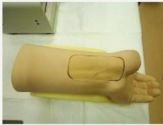
橈骨動脈穿刺 (採血、動脈ライン確保)