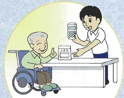
ご本人さまが発送